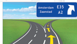
Knooppuntweergave in 3D